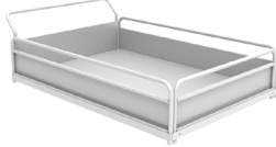
Pritsche 885x1250xh230 mm A031.700