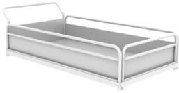
Pritsche 695x1250xh230 mm A030.700