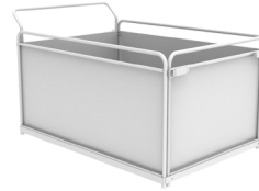
Pritsche 885x1250xh620 mm A031.720