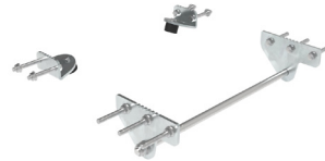
Befestigungskit komplett A403.701