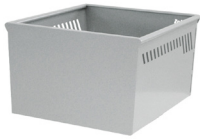
Pritsche 690x730xh440 mm A027.800