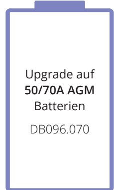
Upgrade auf 50/70A AGM Batterien DB096.070