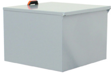
Transportkiste 680x770xh500 mm A055.700