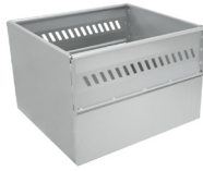
Pritsche 670x730xh500 mm A028.700