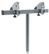
Kupplung für Mülltonnen A190.720