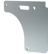
8,5 kg Gegengewicht (max 20 pcs.) Z168.851