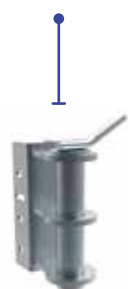
Stift Ø40 mm für Haken A199.706