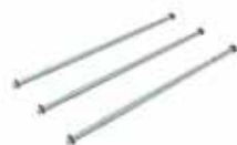
Gegengewicht Anschluss-Set T528.700