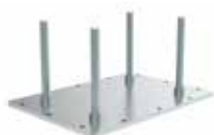
Anschluss-Set für Gegengewicht Z169.852